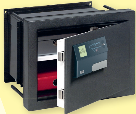
WT 614 E FP