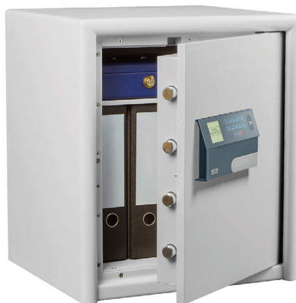
DS 445 E FP