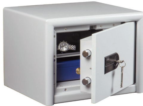
DS 415 K