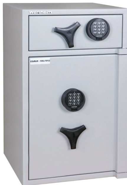
AG 20 DF