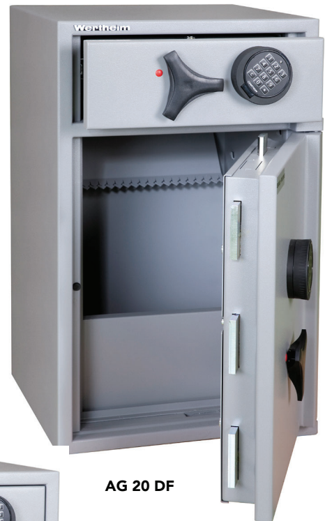
AG 20 DF