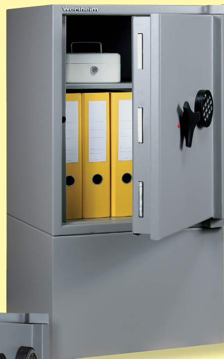
AG 15 avec socle