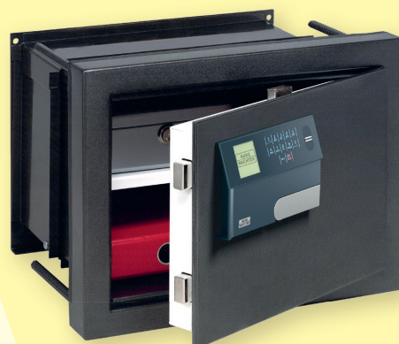
WT 614 E FP