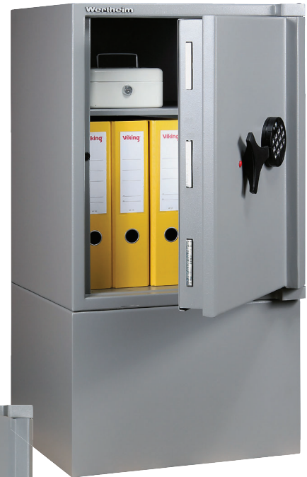
BG 15 MIT SOCKEL