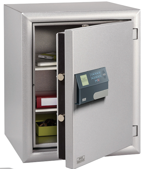
MTD 760 E FP