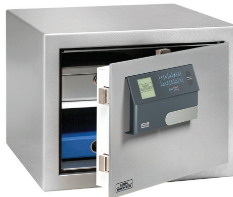
MT 640 E FP